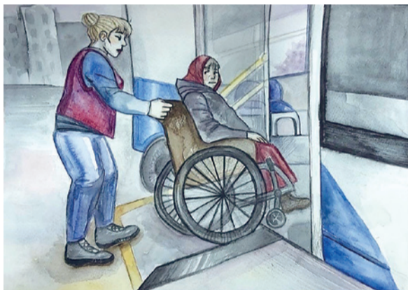
Рисунок Лизы Кубаревой «Маломобильный пассажир»

Троллейбусный парк на Ленинском проспекте из года в год демонстрирует великолепный пример организации корпоративной жизни – держит марку первого порядкового номера! Молодёжь снимает креативные видеоролики о профессии, побеждающие на городском уровне, для работников организуют льготные посещения театров, совместные выезды на природу и занятия спортом. А ещё профком придумывает разные интересные конкурсы, итоги которых традиционно подводят в конце года.