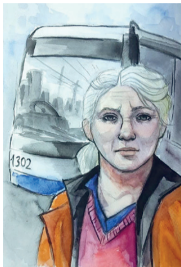
Рисунок Даши Кубаревой «Мама и троллейбус»